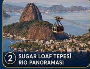
2 SUGAR LOAF TEPESİ RIO PANORAMASI