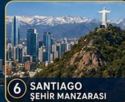
6 SANTIAGO ŞEHİR MANZARASI