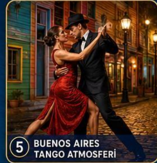
5 BUENOS AIRES TANGO ATMOSFERİ