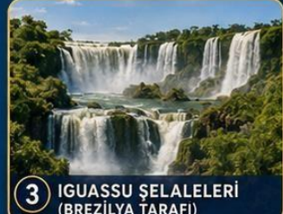
3 IGUAŞSU ŞELELERİ (BREZİLYA TARAFI)