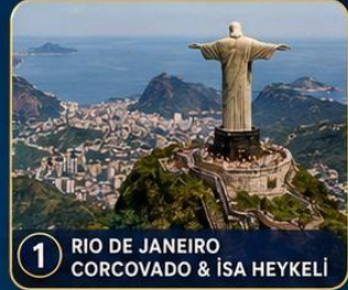
1 RIO DE JANEIRO CORCOVADO & İSA HEYKELİ